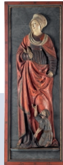
Meister der Mindelheimer Sippe (?), Hl. Elisabeth, Holz gefasst, um 1520