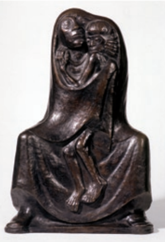
Ernst Barlach, Hungergruppe, Bronze, um 1930

Ernst und Hans Barlach, Lizenzverwaltung Ratzeburg