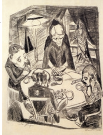
Max Beckmann, Der Hunger, Lithographie, 1919