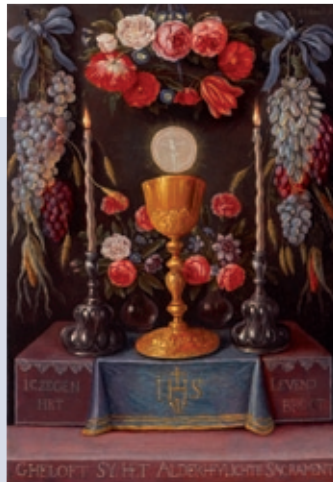
Jan van Kessel, Die Eucharistie, Öl auf Holz, 1646